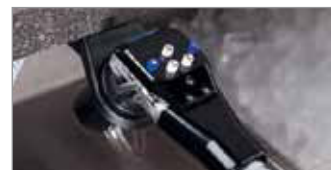
Premezcla 5 Botones (BAR650 Sistema Completo)