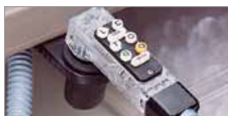
Post-Mezcla 8 Botones (BAR730 Sistema Completo)