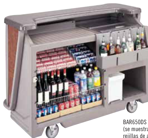
BAR650DS (se muestra con dos rejillas de alambre, opcionales)