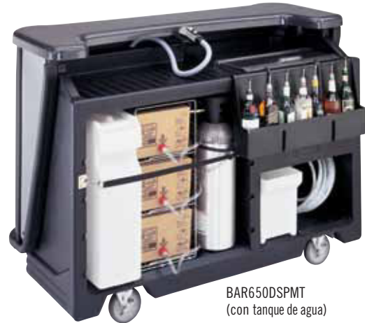
BAR650SPMT (con tanque de agua)