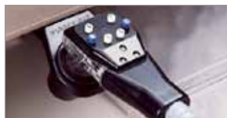
Premezcla 6 Botones (BAR730 Sistema Completo)