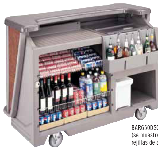
BAR650DSCP (se muestra con dos rejillas de alambre, opcionales)