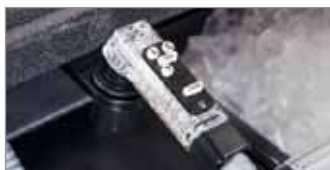
Post-Mezcla 5 Botones (BAR650 Sistema Completo)